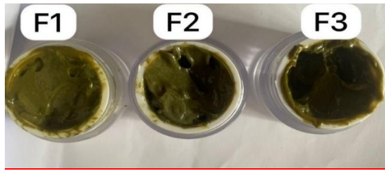
Gambar 2. Gambar organoleptik lotion ekstrak etil asetat daun sirih hijau

Pada parameter bau, ekstrak daun sirih hijau dominan memberikan bau khas sirih. Hal ini dapat dilihat dari sampel F1, F2 dan F3 yang memiliki bau seragam yaitu khas daun sirih. Hal ini dipengaruhi oleh kandungan minyak atsiri yang terdapat dalam daun sirih. Bau tersebut akan memberikan pengaruh pada saraf reseptor dari nyamuk sehingga akan menyebabkan terjadinya gangguan pada kemampuan nyamuk untuk mendeteksi keberadaan manusia (Marlik et al., 2022).